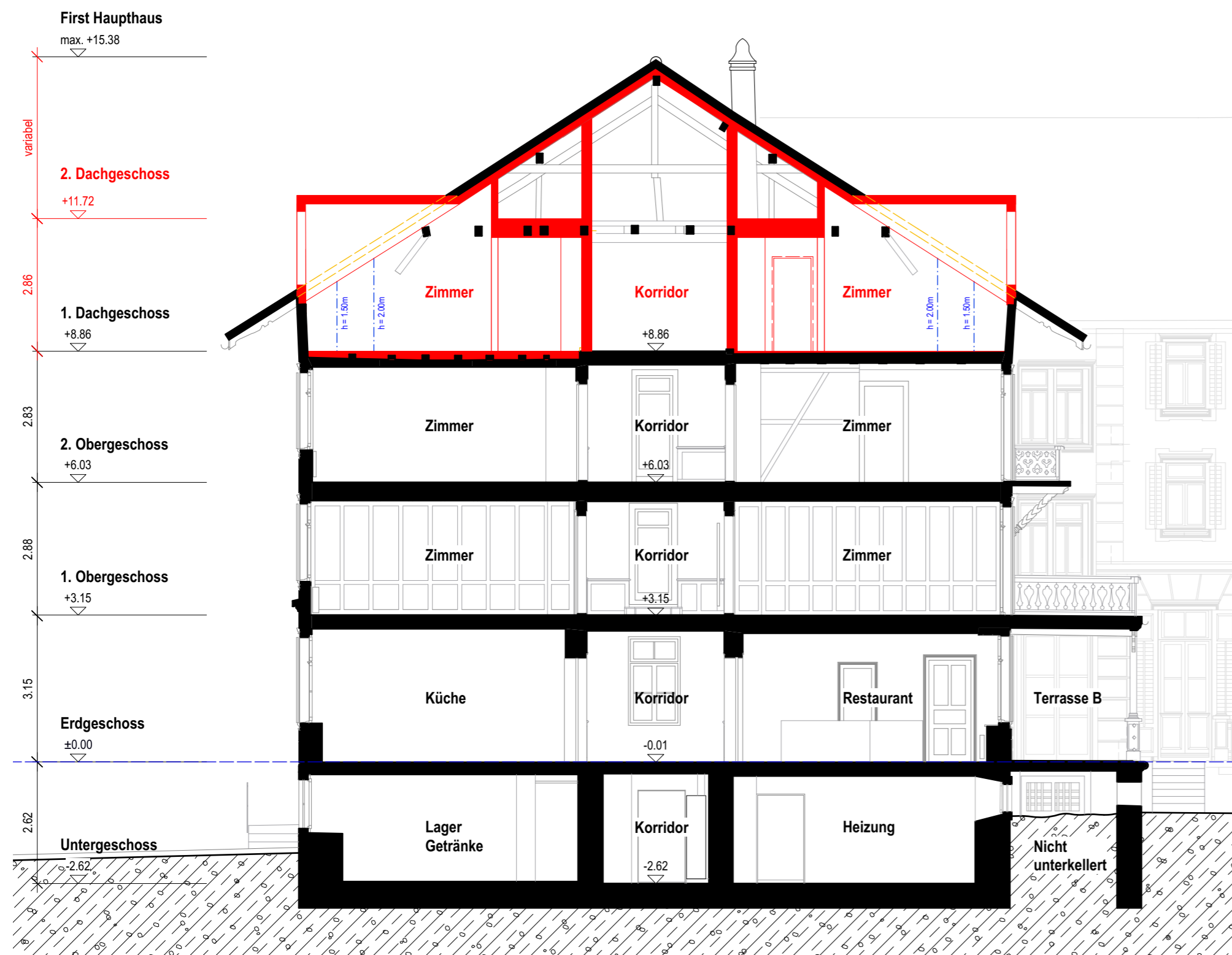
QUERSCHNITT 4-4 (HAUPTHAUS)