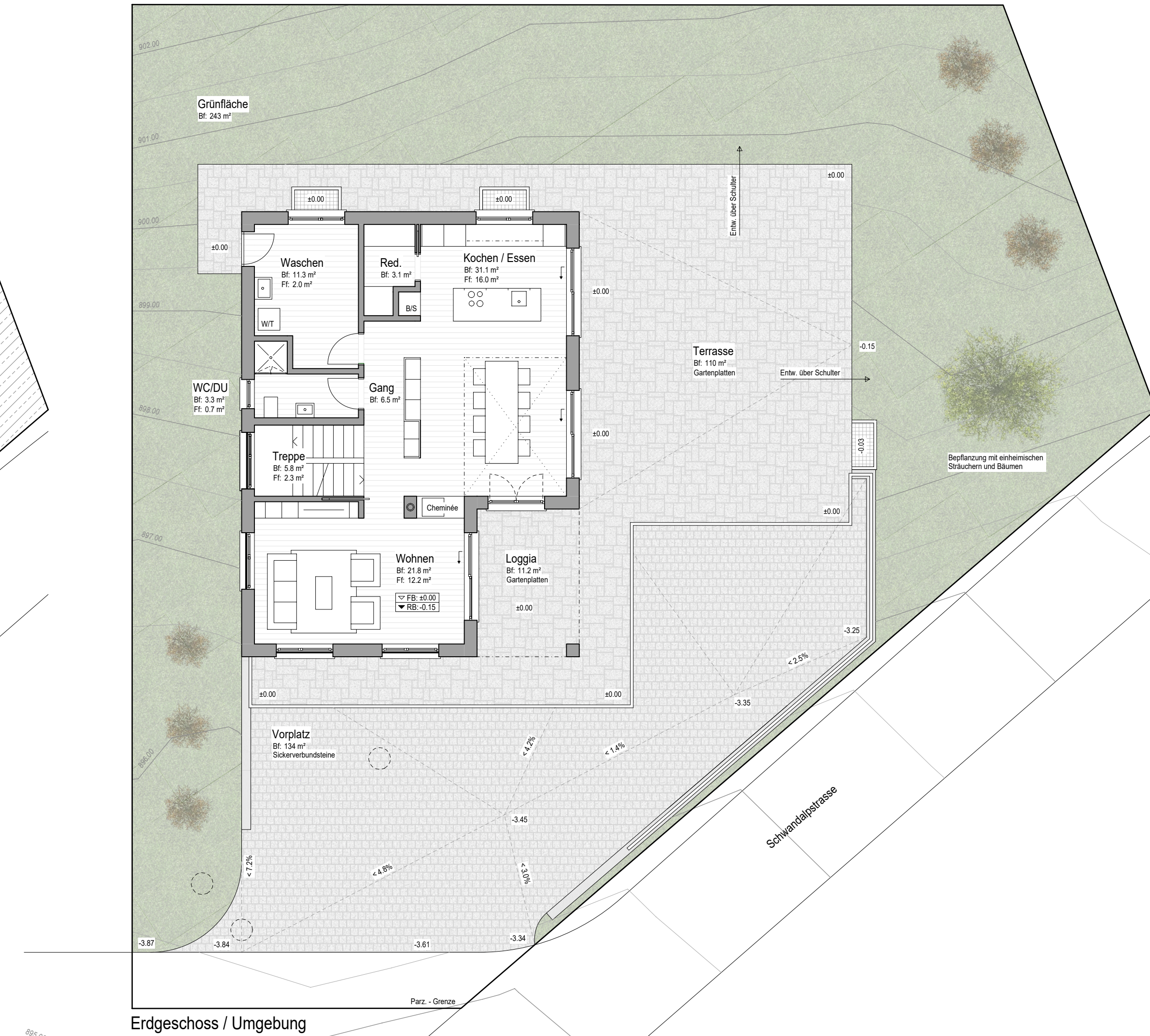
Erdgeschoss / Umgebung